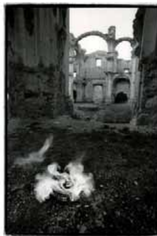
Tríptico Cuevas de Cañar