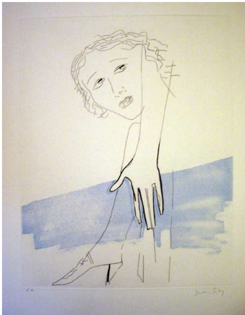
“LA BALLADE DES DAMES HORS DU TEMPS”

Técnica: Grabado sobre Papel Arches, firmado y numerado a lápiz.